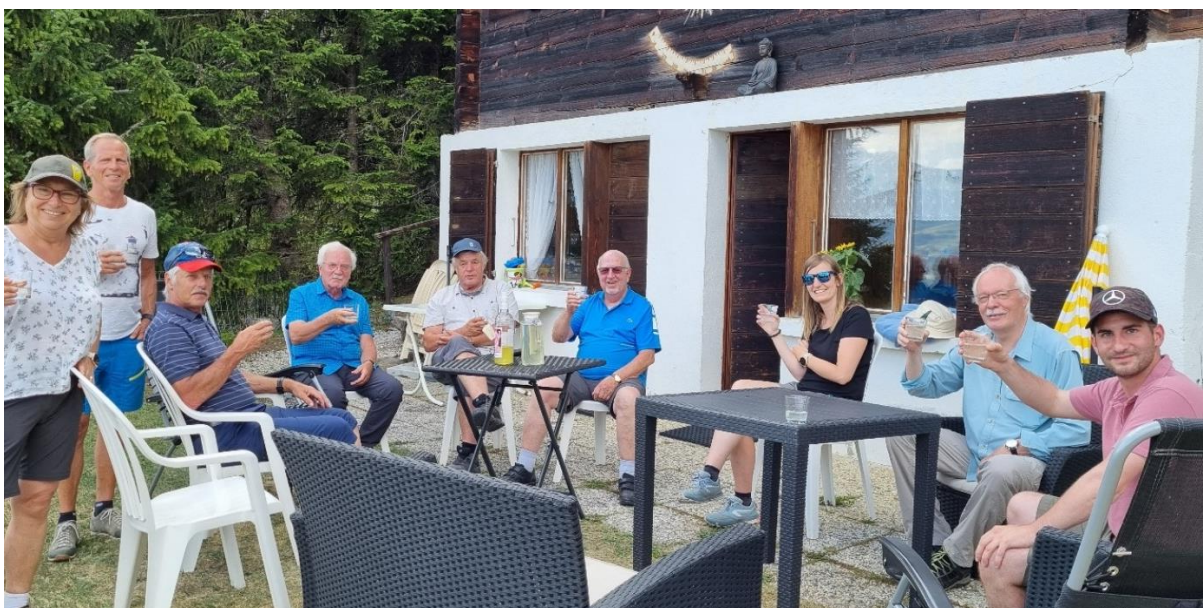
Abschiedstrunk des Vorstands mit dem Grossratspräsidenten und seiner Partnerin